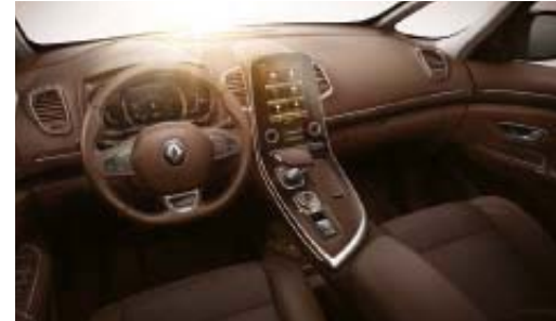
Tablero de a bordo marrón oscuro