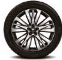
INITIALE PARIS 19"