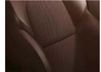
Tapicería mixta tejido/símil cuero marrón oscuro