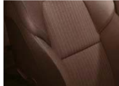
Tapicería de tejido marrón oscuro