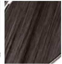
Personalización de la consola central Silverwood