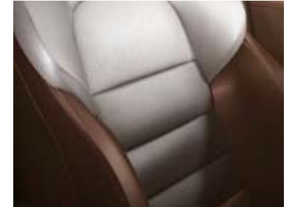
Tapicería de cuero* marrón oscuro / gris claro