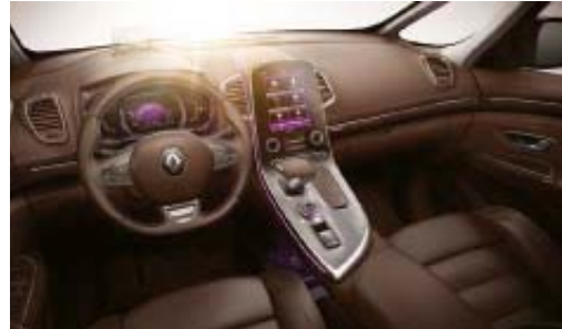
Tablero de a bordo marrón oscuro